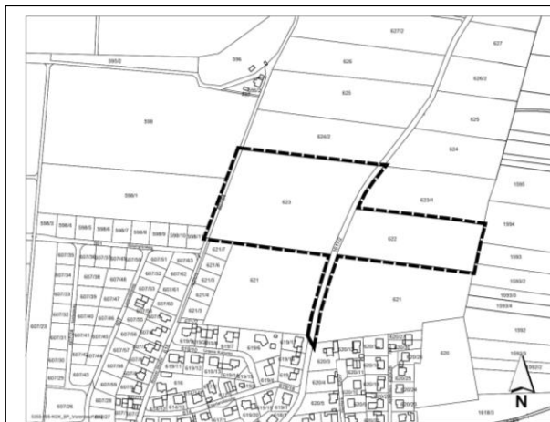
Übersichtslageplan Bebauungsplan o. M.

Der Inhalt dieser Bekanntmachung sowie der Entwurf des Bebauungsplans für das Gebiet „Heiligengarten“ in der Fassung vom 2. Dezember 2024, bestehend aus Planzeichnung (Teil A), textlichen Festsetzungen (Teil B) und Begründung einschließlich Umweltbericht (Teil C) werden gemäß § 3 Abs. 2 BauGB